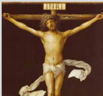
Cristo sulla Croce A. Dürer

La stessa indulgenza può essere acquistata, una sola volta al giorno, anche visitando il cimitero dall'1 all'8 novembre.