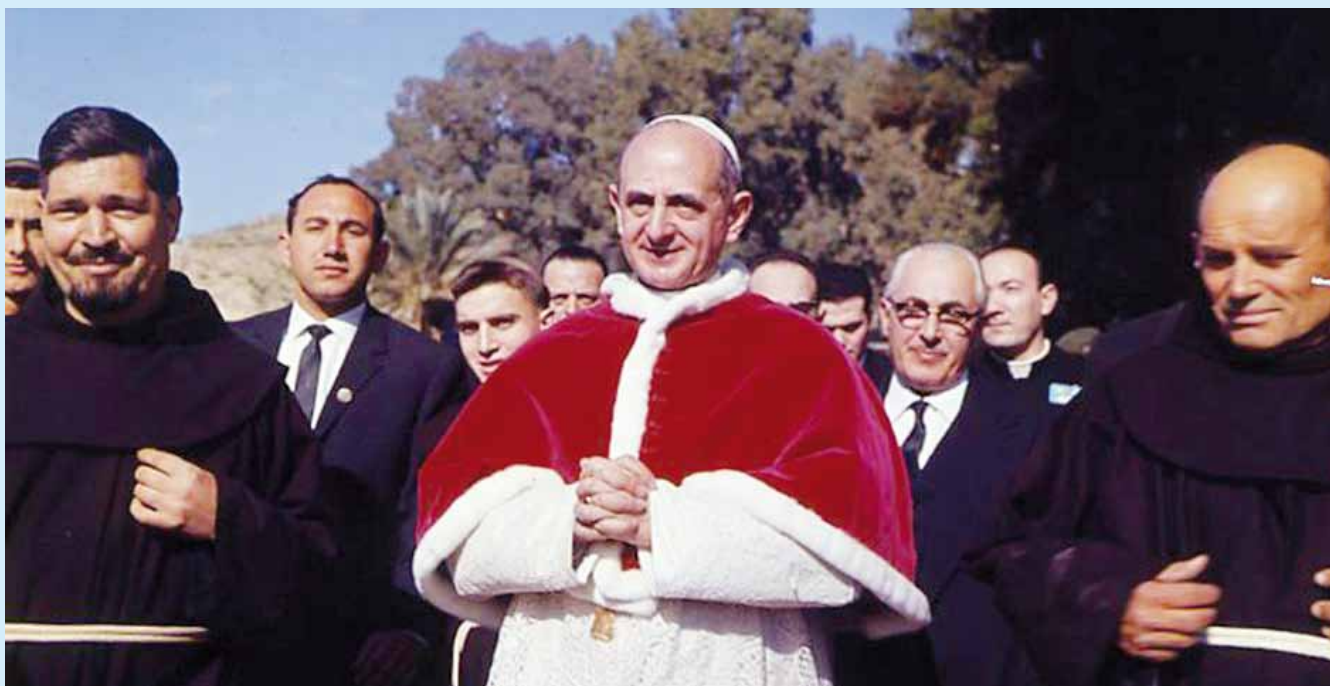
1964 – Paolo VI in Terrasanta