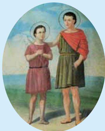
SS. Martiri Fabio e Vincenzo