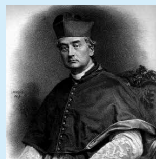
Card. Fabio Maria Asquini (1802–1878)

Il racconto del ritrovamento e della traslazione è narrato nel libro sulla storia di Fagagna scritto dall'allora parroco don Angelo Tonutti e dedicato al matrimonio dei Conti Fabio Asquini e Angela Panciera di Zoppola (1914). In occasione della traslazione venne composto dal musicista cividalese Jacopo Tomadini (1820–1883) l'inno proprio dei due S. Martiri. La musica viene considerata “un gioiello squisito di musica sacra” . Al responsorio proprio dei S. Martiri Papa Pio IX concesse particolari indulgenze.